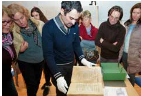
V živo smo si ogledali originalni mestni statut!

Potem smo se razdelili v skupine, ki so raziskovale posamezne dele obzidja. Zanimalo nas je, kje in v kakšni meri je obzidje še ohranjeno? Kaj je originalno in kaj je bilo prezidano ali rekonstruirano? Iskali smo napisne plošče in grbe, postavljene v spomin na gradnjo ali obnavljanje obzidja. Poskušali smo opaziti in raztolmačiti detajle in elemente, ki jih zasledimo na obzidju.