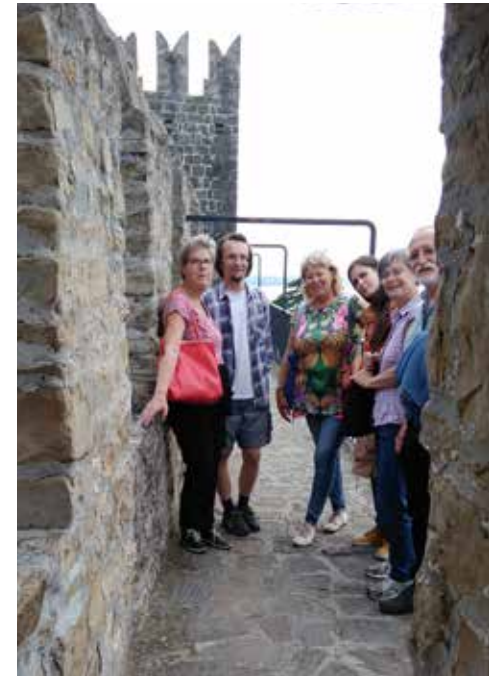
Druženje na vrhu obzidja.

Z rednim vzdrževanjem in osveščanjem prebivalcev o tem dragocenem pomniku preteklosti mesta obzidja ne bomo le bolje varovali, temveč ga bomo še lažje in uspešneje vključevali v turistično ponudbo. Ohranjanje in prepoznavnost sta namreč pogoj, da bo tudi na piranskem obzidju – kot pravi geslo Evropskega leta kulturne dediščine – preteklost srečala prihodnost.