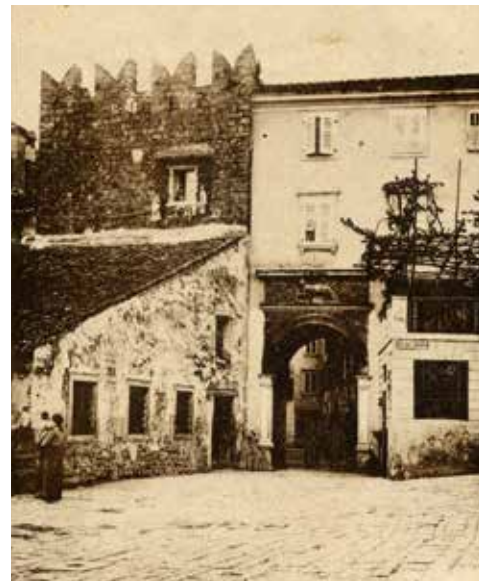
Pred sto leti je bil stolp ob Marčanskih vratih še viden.

Za predmet te ljubiteljske raziskave smo si izbrali piransko obzidje. Eno glavnih atrakcij mesta, ki pa razen prepoznavne silhuete na pobočju nad mestom zajema še druge elemente: mestna vrata, odseke, ki so opazni v urbanističnem tkivu in take, ki se skrivajo v stavbah, ki so zrasle okoli njih.