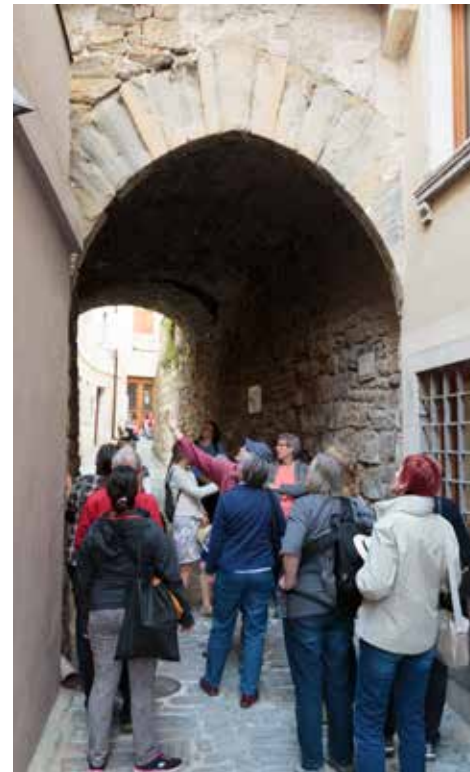
Debata ob opazovanju detajlov.

Rezultati so nas navdušili: Obzidje se razen na pobočju nad mestom skriva še marsikje, lastniki stavb, ki so naslonjene nanj pa ga velikokrat s ponosom ohranjajo in skrbijo zanj. Obzidje je namreč živ organizem, ki se kljub častivredni starosti ves čas obnavlja – tako v minulih stoletjih kot v zadnjih petdesetih letih. Zdaj vemo, da so skrivnostne niše v obzidni ulici ostanki topovskih položajev in da so »ušesa« med merloji na stolpih držala lopute, ki so varovale branilce pred izstrelki napadalcev. Razumemo tudi, da ledinski imeni »Batifredo« in »Raštel« izhajata iz fortifikacijske terminologije. Razen že publiciranih grbov smo odkrili še kakšnega, ki je skrit očem, a hkrati opazili, da zob časa uničuje najbolj izpostavljene in na to opozorili pristojne službe.